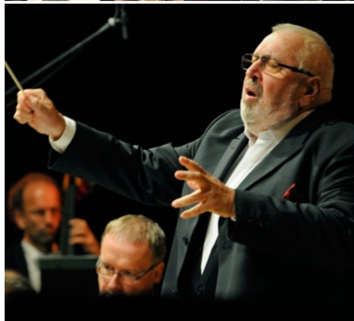
SÄCHSISCHE STAATSKAPELLE DRESDEN MICHAÏL JUROWSKI