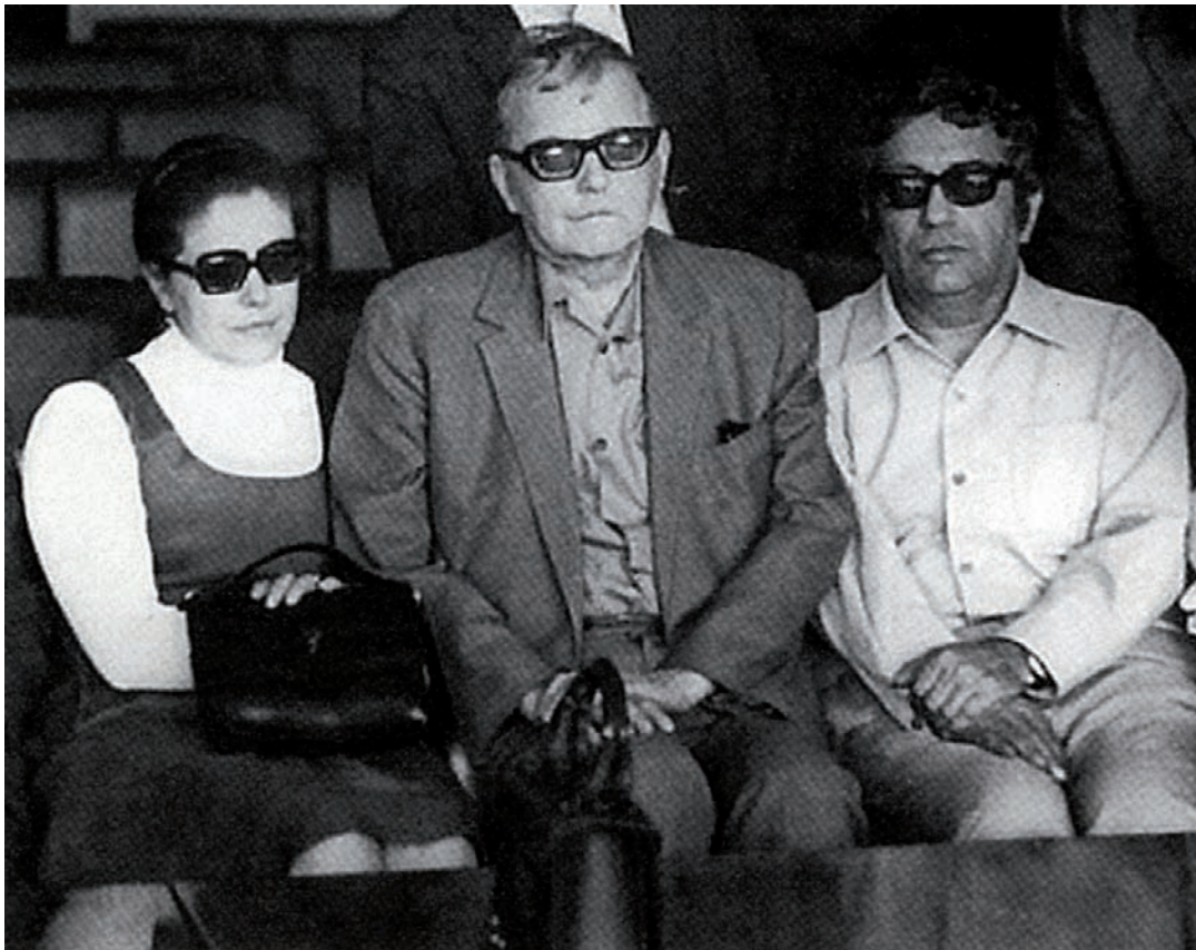
Irina Chostakovitch, Dimitri Chostakovitch lors d'un voyage en Azerbaïdjan avec Kara Karaev