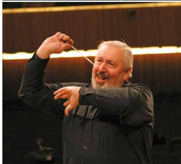
SÄCHSISCHE STAATSKAPELLE DRESDEN MICHAIL JUROWSKI