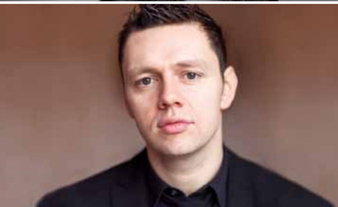
IGOR LEVIT SERGEI NAKARIAKOV CHRISTIAN FRIEDEL